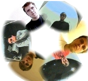
(b) Interface du puits

FIG.: Le puits comme métaphore de téléprésence