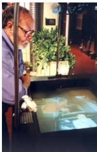
(a) Utilisation du puits