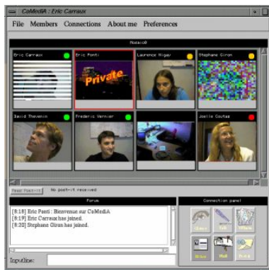
FIG.: Capture d'écran de Cooperative Action Mediaspace

INRIA Sophia Antipolis – projet pour favoriser la cohésion de groupe parmi les télétravailleurs